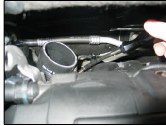
Fig. # 15