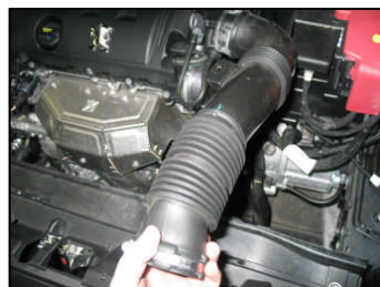
Fig. # 6