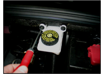
Fig. # 20