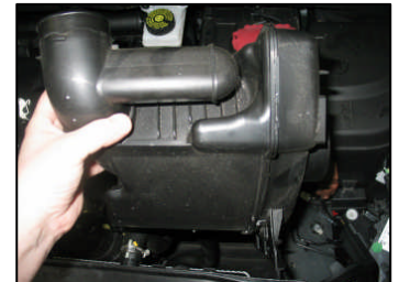
Fig. # 4