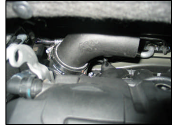
Fig. # 16