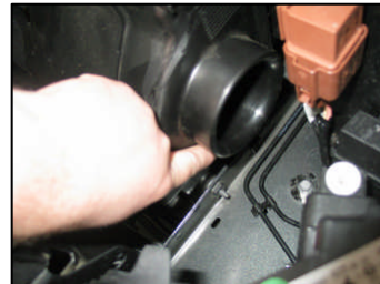
Fig. # 3