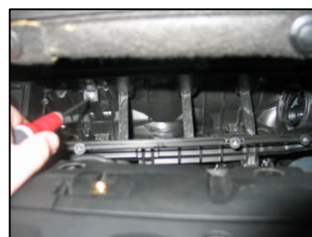
Fig. # 11