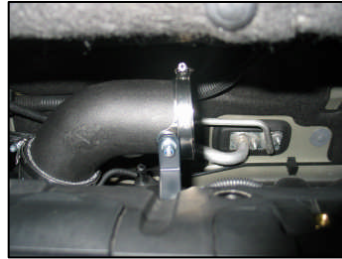
Fig. # 19