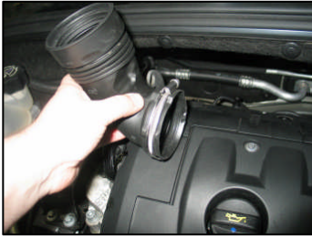
Fig. # 13