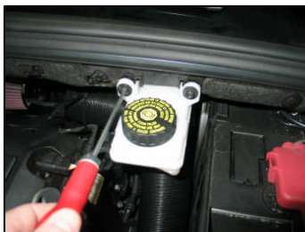
Fig. # 25