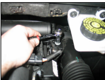
Fig. # 5