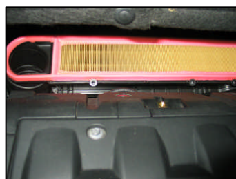
Fig. # 10