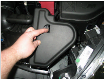
Fig. # 1

FILTER MAINTENANCE: K&N suggests checking the filter periodically for excessive dirt build-up. When the element becomes covered in dirt (or once a year), service it according to the instructions on the Re-charger service kit available from your K&N dealer, part number 99-5003EU.