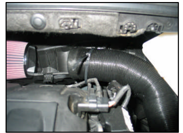
Fig. # 24