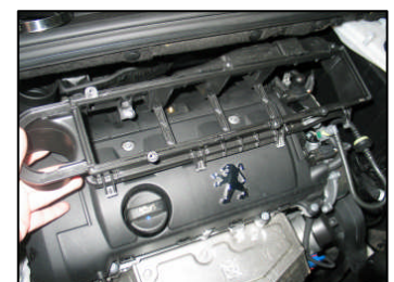
Fig. # 12

For technical support contact our European technical team: " eindhoven.tech@knfilters.com " We will try to answer your mail within 48 hours.