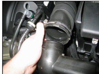
Fig. # 2