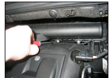
Fig. # 8