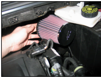
Fig. # 21