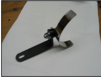
Fig. # 17