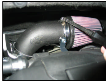
Fig. # 22