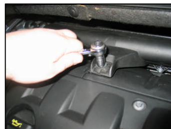
Fig. # 7