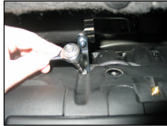
Fig. # 18