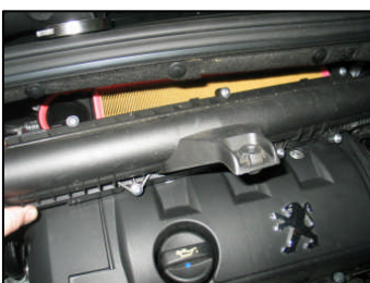
Fig. # 9