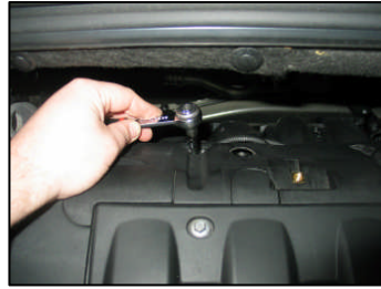
Fig. # 14