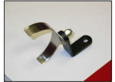
Fig. # 4