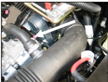
Fig. # 5