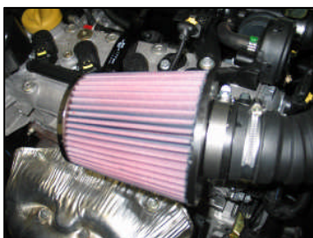
Fig. # 9