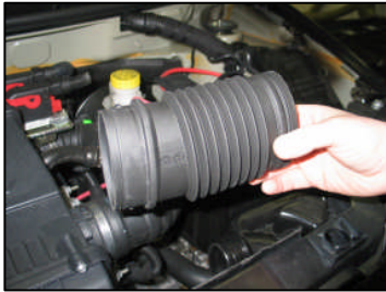
Fig. # 1

FILTER MAINTENANCE: K&N suggests checking the filter periodically for excessive dirt build-up. When the element becomes covered in dirt (or once a year), service it according to the instructions on the Re-charger service kit available from your K&N dealer, part number 99-5003EU.