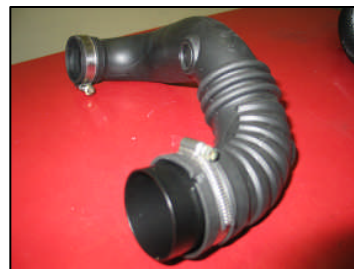
Fig. # 7