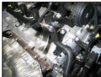
Fig. # 6