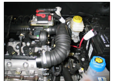
Fig. # 8