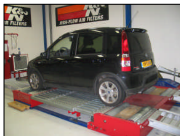
Fig. # 10