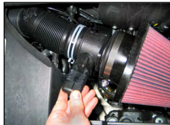
Fig. # 18