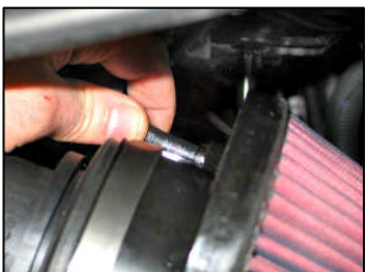
Fig. # 20