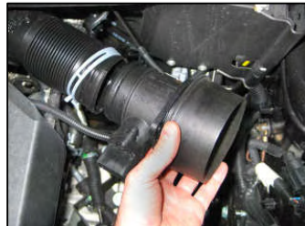
Fig. # 14