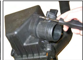
Fig. # 11