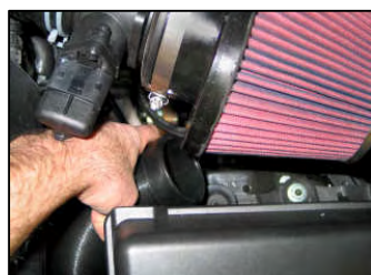
Fig. # 22