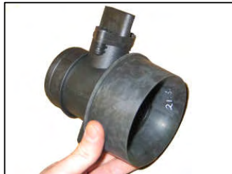
Fig. # 13