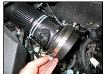
Fig. # 15