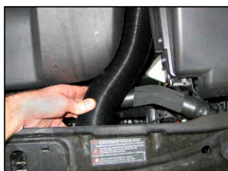
Fig. # 21