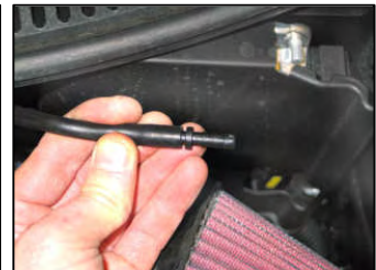
Fig. # 19