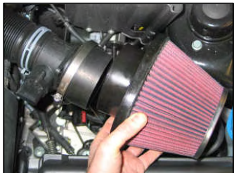
Fig. # 16