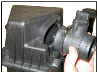
Fig. # 12