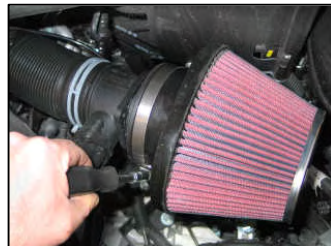
Fig. # 17