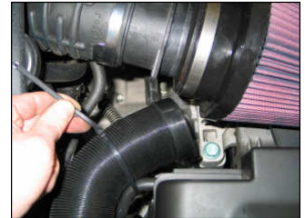
Fig. # 20